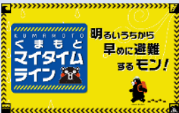
「くまもとマイタイムライン」