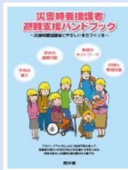
「災害時要援護者避難支援ハンドブック」