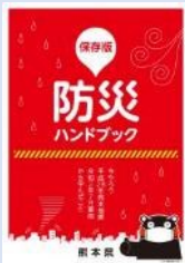
「防災ハンドブック」