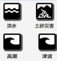
「ハザードマップ」 国土交通省